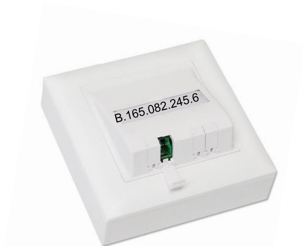
OTO Steckdose / Glasfaser-Steckdose OTO = optical telecommunications outlet

Herr Muster Musterstrasse 1 4500 Solothurn